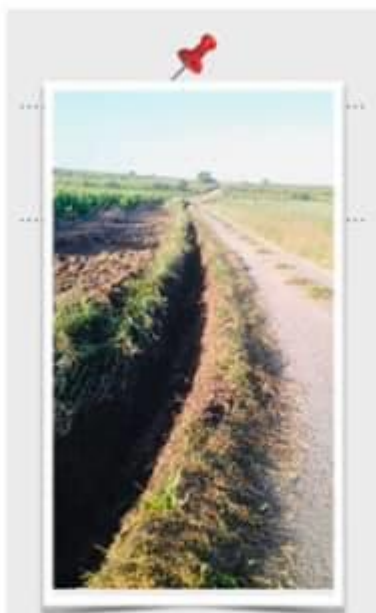
Création d'un fossé lieu-dit Bourdiol