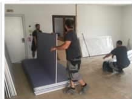
Réfection du Pôle multiservices en Forum Médical